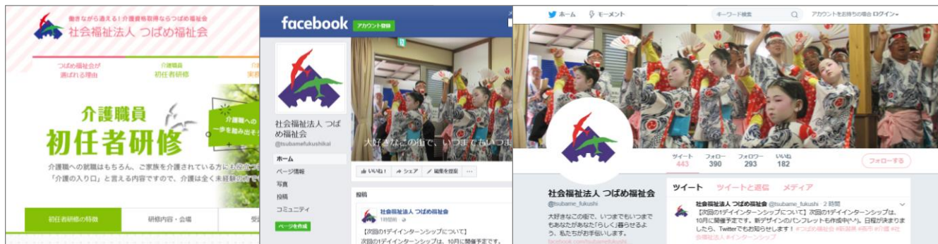
■ 研修ホームページ

～ 研修ホームページ公開！ facebookページ、Twitter 更新中！～ 施設の様子や研修情報、採用情報なども発信しています。